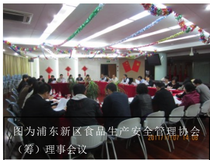
图为浦东新区食品生产安全管理协会(筹)理事会议