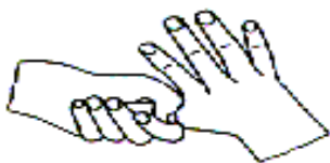
5. 拇指在掌中转动搓擦