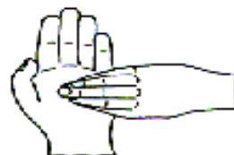
6. 指尖在掌心中搓擦